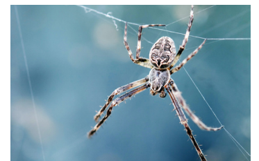
Otras arañas (excepto la de telaraña en embudo y las grandes arañas negras)