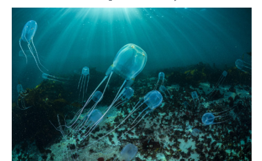
Cubomedusa y medusa Irukandji