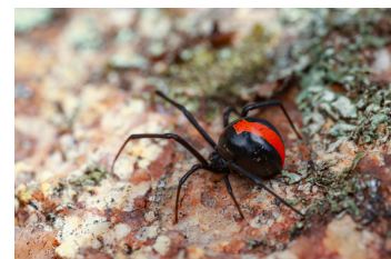
Arañas de lomo rojo