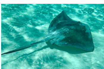
Rayas de aguijón