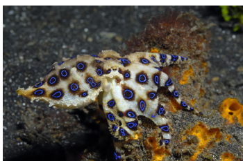
Pulpos de anillos azules