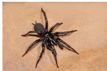
Araña de telaraña en embudo y grandes arañas negras