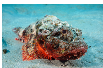
Peces con aguijones (incluido el pez piedra)