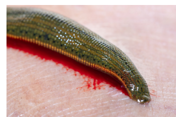
Sanguijuelas (primero eliminar la sanguijuela y lavar el área)