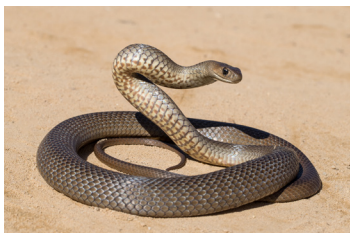
Serpientes australianas, incluidas serpientes marinas